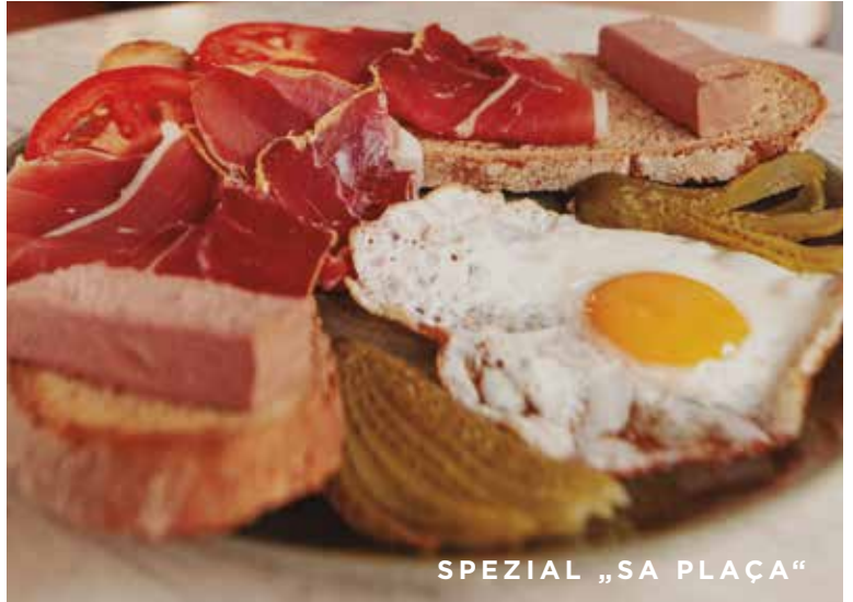
SPEZIAL „SA PLAÇA“