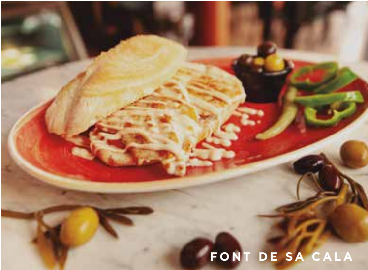
FONT DE SA CALA