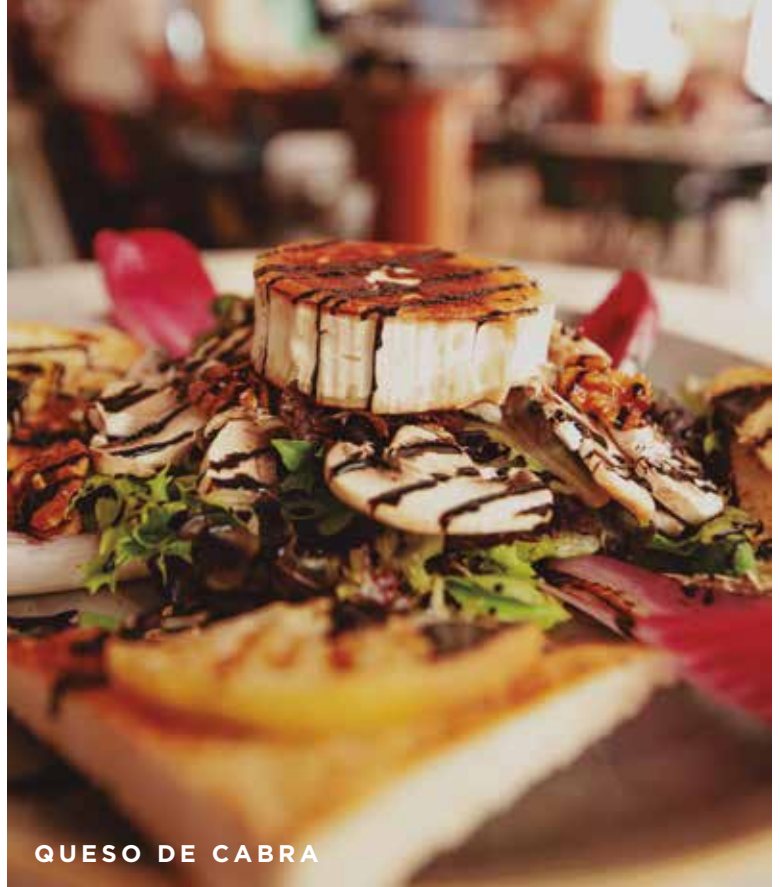
QUESO DE CABRA