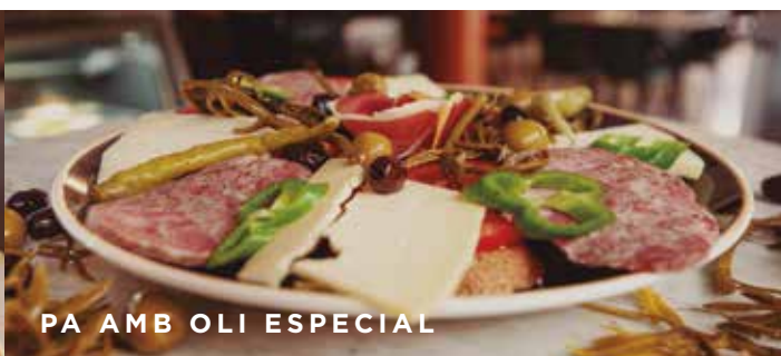
PA AMB OLÍ ESPECIAL