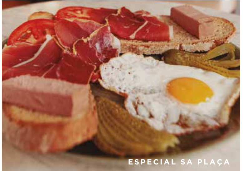
ESPECIAL SA PLAÇA