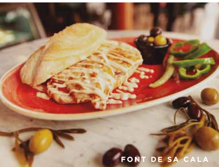
FONT DE SA CALA